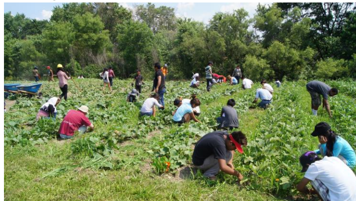
Photo: Under the leadership of BACI in collaboration with the City of Indianapolis and other partner organizations, the communities came together to engage in volunteer and community service at Indy Urban Acres Farm as part of the "Giving Back to the Community" Project on World Refugee Day 2013.

MLK Day Service Project: BACI is partnering with the University of Indianapolis, Chin Community of Indiana, and the Falam Christian Church of Indianapolis in a day of community service on the Martin Luther King, Jr. holiday. The students will work at three separate locations painting and cleaning.