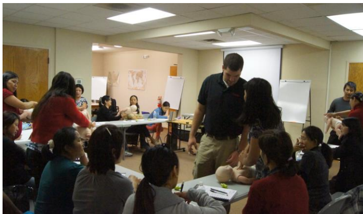
Women at First Aid and CPR Training

Please see more information and childcare addresses on page 5, 10 & 11.